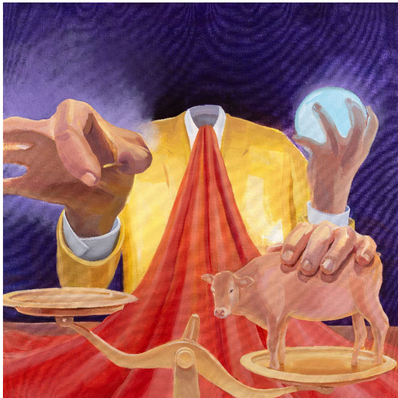
김진, <거인의 시선은 어디에나 있다 #5>, 2025, Acrylic on canvas, 162x162cm