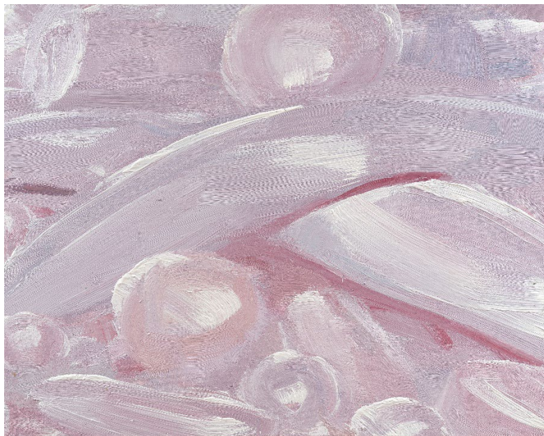
김진, <정물_ 핑크는 없다#202504_11q-3>, 2025, Oil on canvas, 73x91cm