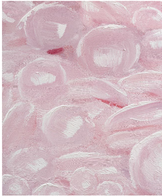
김진, <정물_ 핑크는 없다#202505_11q-1>, 2025, Oil on canvas, 73x61cm