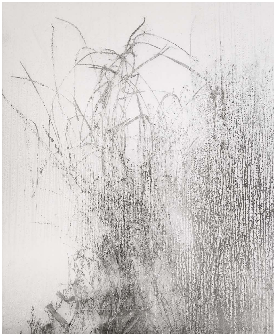
Weed uq06_gelatin silver print_120x103cm_1993, print year 2014