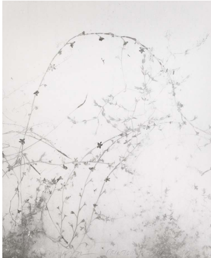
Weed uq07_gelatin silver print_120x103cm_1996, print year 2014

전시명 민병헌 개인전 <Monologue> 전시일정 2015. 04. 18 – 2015. 05. 19 오픈닝 2015. 04. 18 (Sat) PM 5 전시연계강의 일시 및 장소: 2015. 04. 18 (Sat) PM 3, 갤러리 플래닛 강의자: 이지윤 큐레이터(국립현대미술관 서울관 운영부장) 강의내용: 민병헌의 사진 세계 신청방법: 이메일(info@galleryplanet.co.kr)을 통한 사전 예약 전시장소 서울시 강남구 논현로 175길 93 웅암빌딩 2F 갤러리 플래닛 T. 02 540 4853 www.galleryplanet.co.kr 담당자 방소연 실장 sy@galleryplanet.co.kr | CP. 010 2709 6376 자료 다운로드 웹하드 ID | galleryplanet PW | planet GUEST 폴더 > 내리기 전용 > 민병헌 개인전