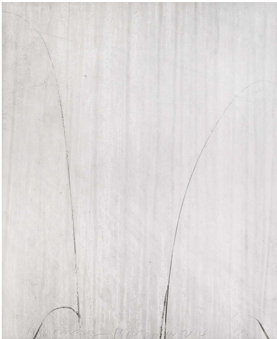
Weed uq01_gelatin silver print_120x103cm_1996, print year 2014