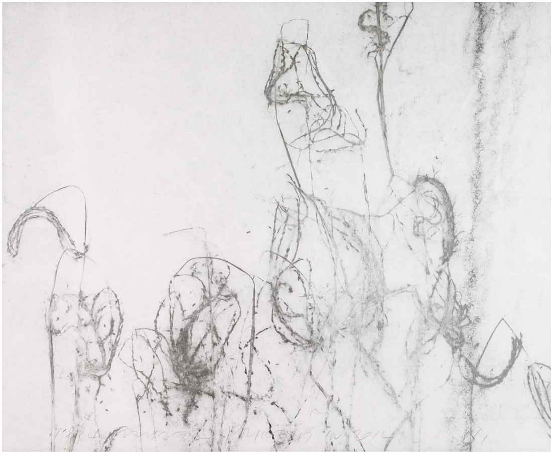
Weed uq05_gelatin silver print_103x120cm_1994, print year 2014